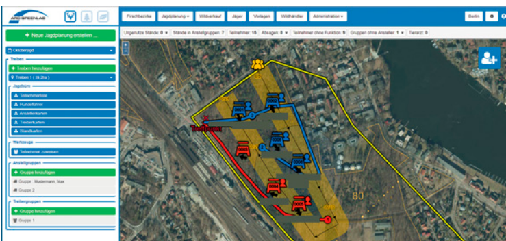
Jagdplanung mit Luftbild-Grundkarte